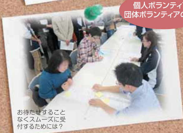
個人ボランティア、団体ボランティアの受付