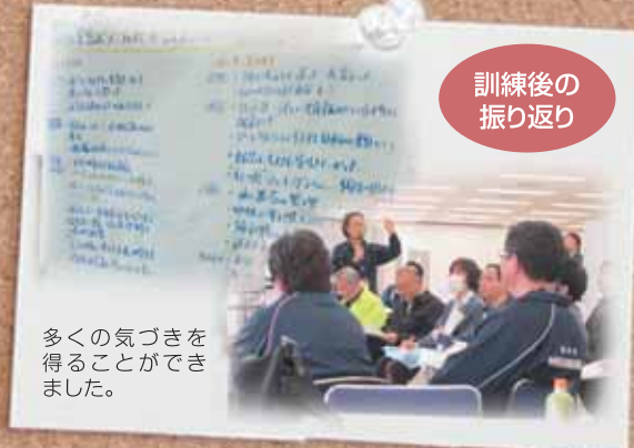
訓練後の振り返り