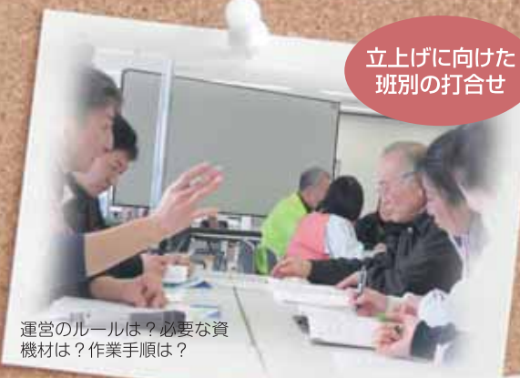
立上げに向けた班別の打合せ

災害ボランティアセンターは、被災して困っている方たちの「助けてほしいこと」「手伝ってほしいこと」を受け止め、各地から集まってくださるボランティアさんの拠点となり、被災地復旧のための活動へとつなげていくセンターです。