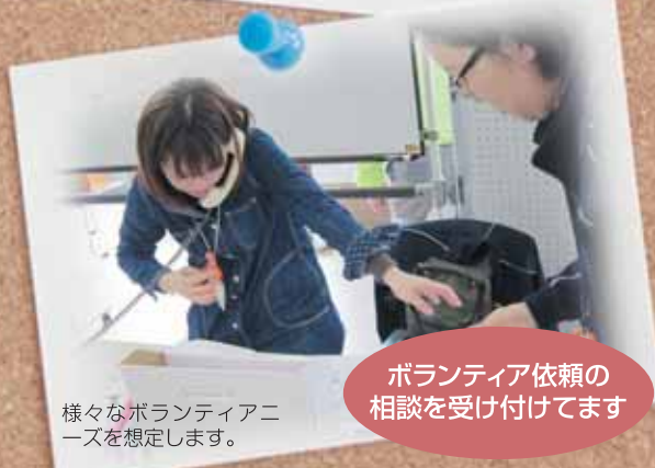
ボランティア依頼の相談を受け付けてます