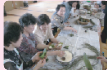
「親松えんがわの会の“ちまきづくり”」

自治・町内会を単位に、誰もが気軽に集まり、情報交換や交流できる場を作ります。立ち上げ、運営の相談や助成を行っています。各地域にさまざまなサロンが立ち上がっています。