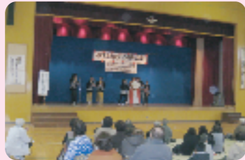
「平成20年12月14日：有明台地区歳末ふれあいお楽しみ会」

歳末たすけあい募金の配分事業として、歳末時期に地域や施設で行われる世代交流事業等に助成を行います。 (例：クリスマスコンサート、餅つき大会 など)