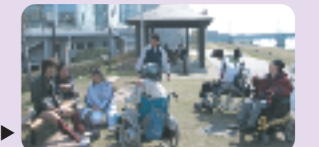
やすらぎ堤への外出▶