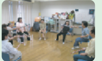
「寄居コミュニティハウス」