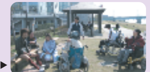
やすらぎ堤への外出▶