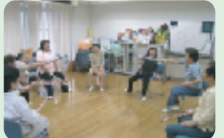
「寄居コミュニティハウス」