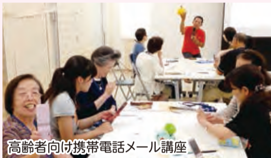
高齢者向け携帯電話メール講座