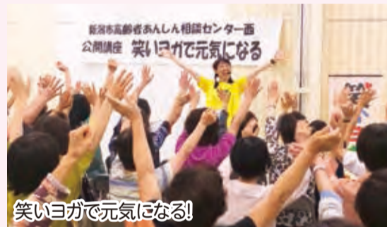
笑いヨガで元気になる!